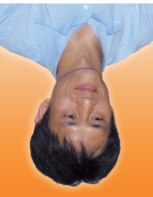
鍼灸師 気療士 介護福祉士 健康管理士